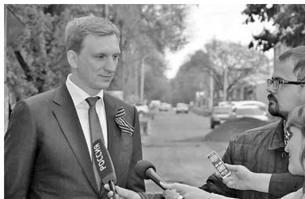
Глава Эссентуков Александр Некристов

https://w-ip.ru/v2/novosti-goroda-zheleznovodsk/v-zheleznovodske-obsuzhdali-kak-prevratit-goroda-kurorty-v-istoricheskie-poseleniya